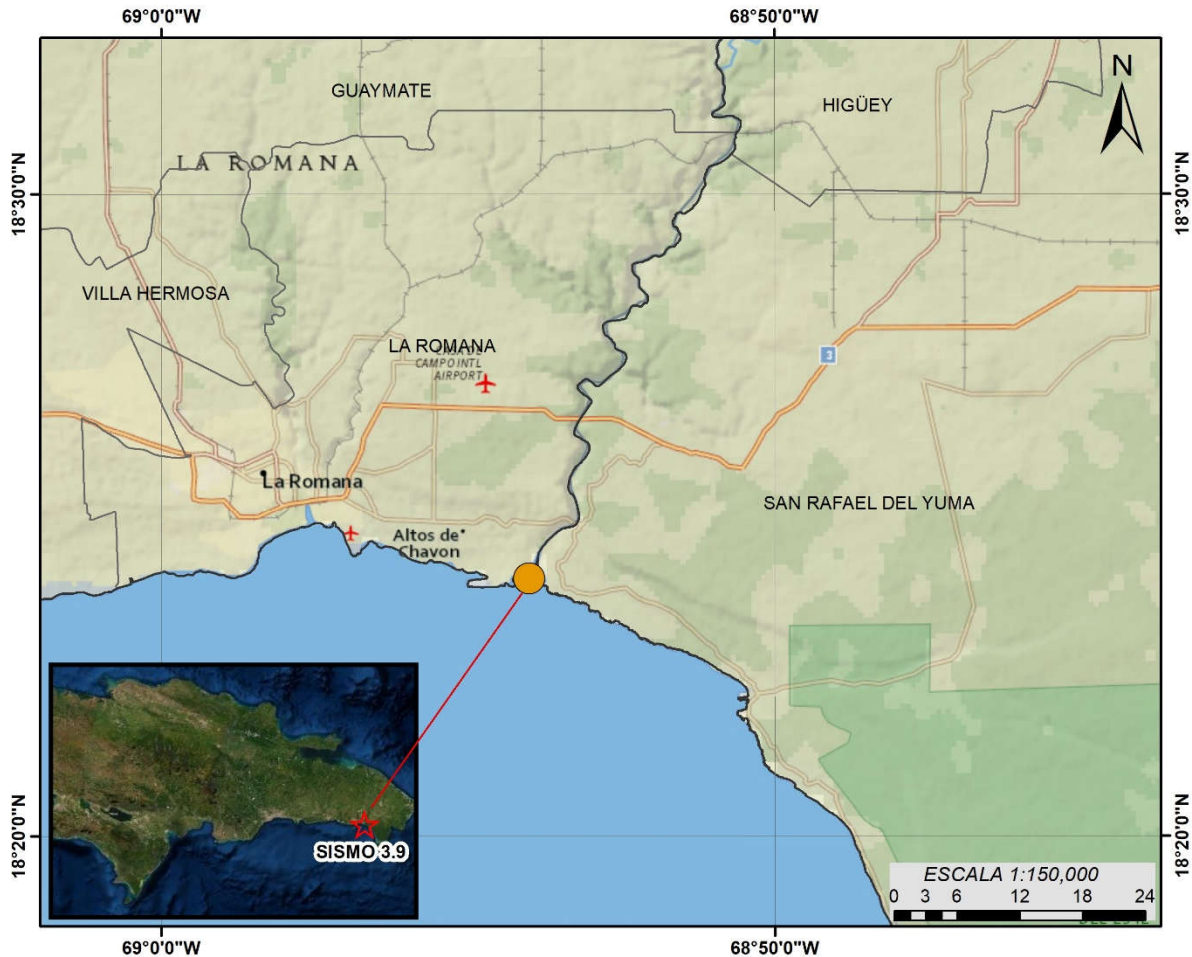
Fig. 1 Mapa epicentral