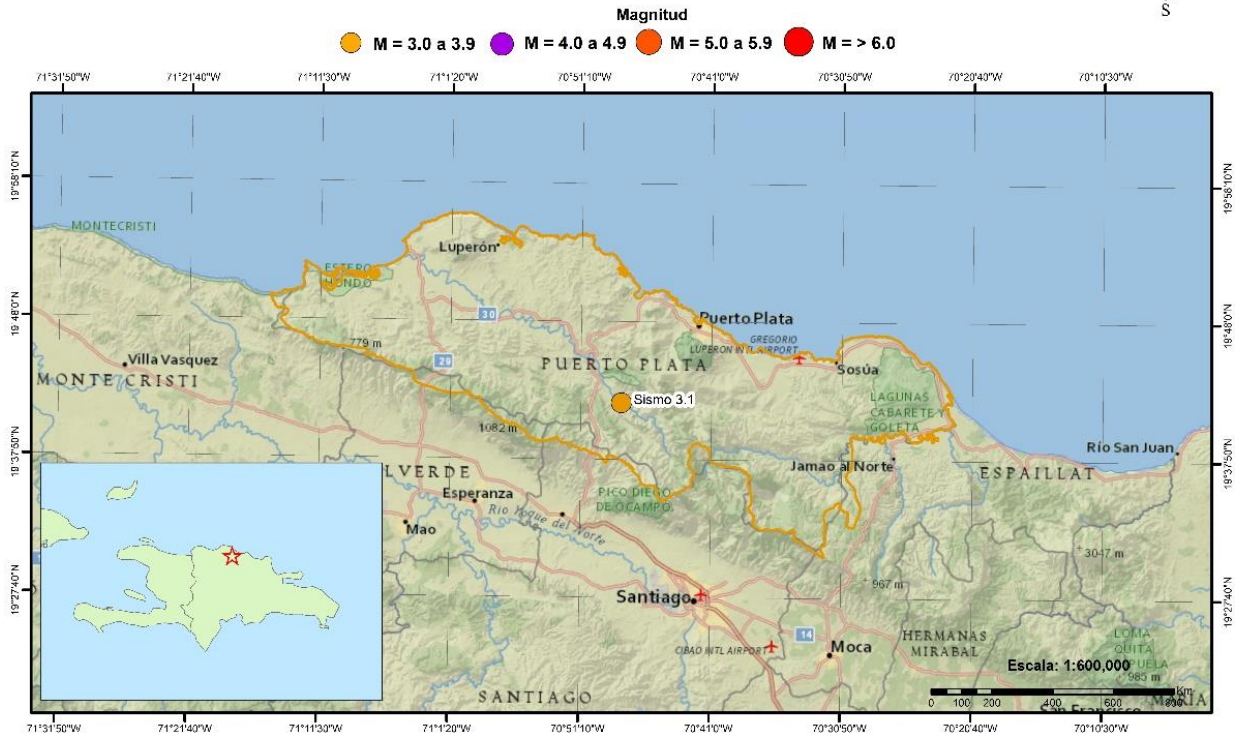
Fig. 1 Mapa epicentral